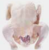
Whole chicken without giblets - Griller Pollo entero sin menudos