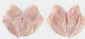
Skinless boneless whole breast Pechuga entera sin piel y sin hueso