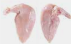
Bone-in and skinless fillet Fillet con hueso y sin piel (suprema)