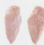
Half skinless boneless breast Media pechuga sin piel y sin hueso